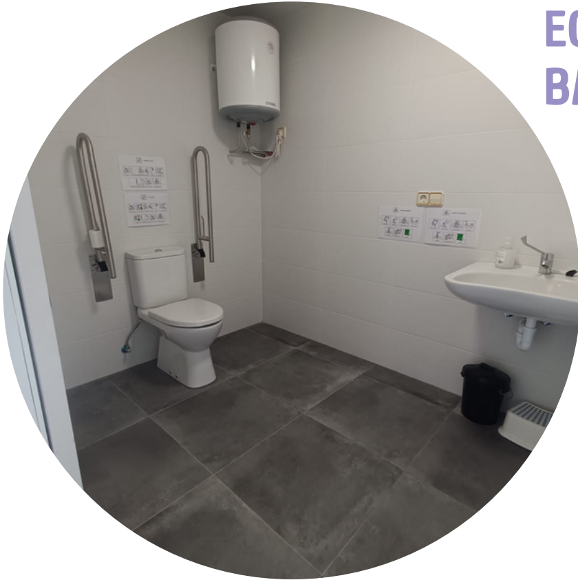
EGOKITUTAKO 2 BAINUGELA